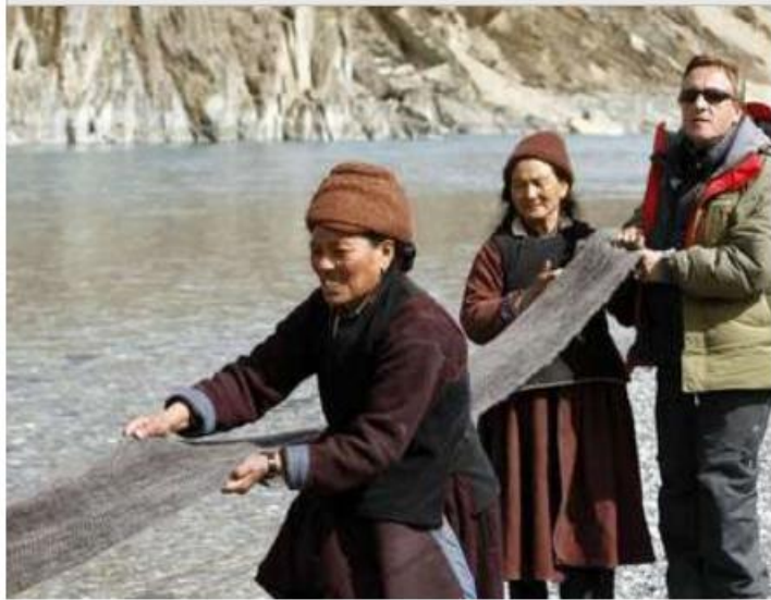
Zanskar et Ladakh